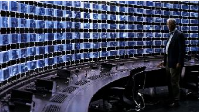
Panopticon: “the few watching the many”