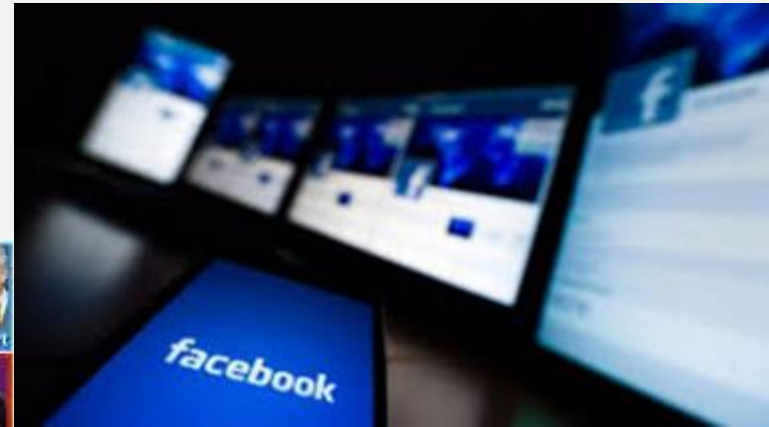
Diopticon: “the many watching the many” F. Tabarki