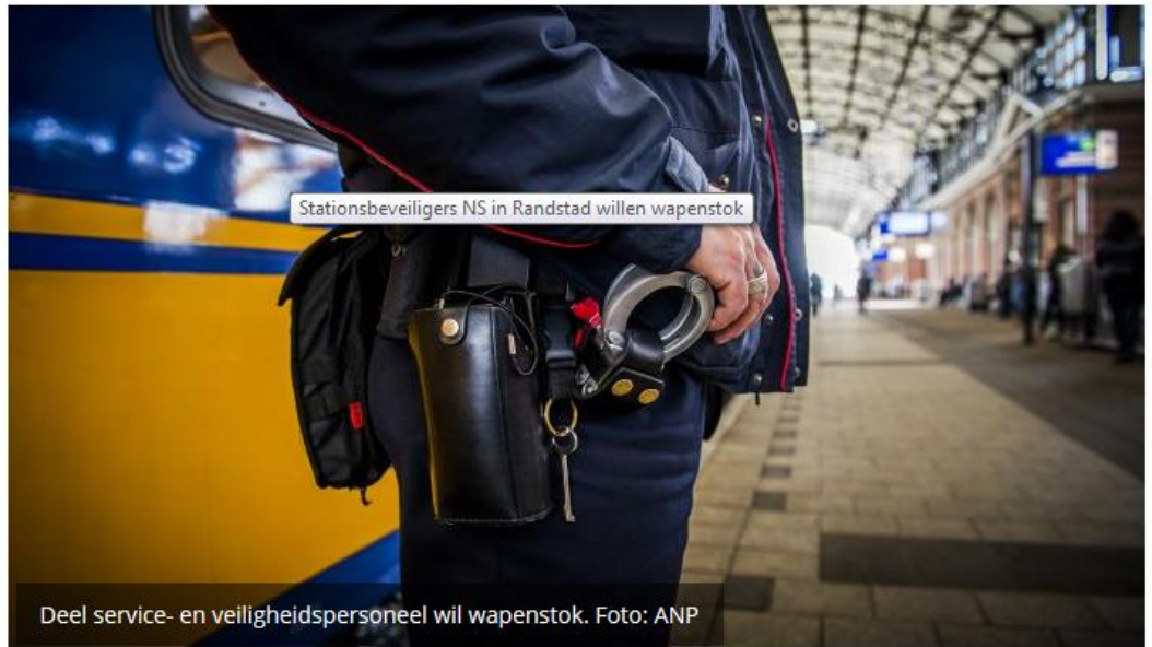
Stationsbeveiligers NS in Randstad willen wapenstok

6 januari 2016 om 16:00 door Anne-Fleur Pel