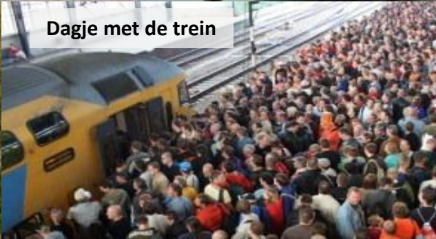
Dagje met de trein